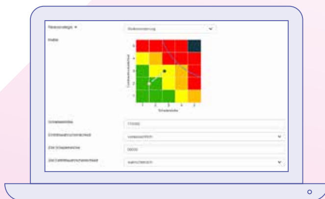
Abb. 3 Risikobewertung