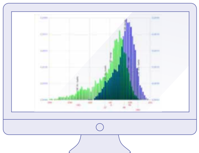
Abb. 5 Simulation